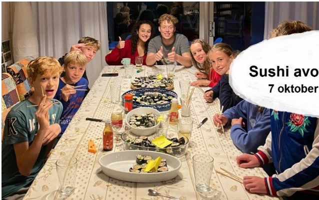
Sushi avond 7 oktober