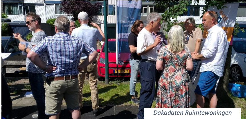
Dakdaten Ruimte woningen