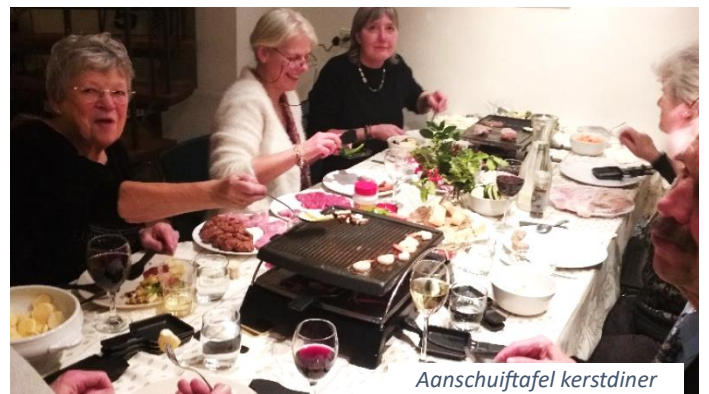
Aanschuif tafel kerstdiner