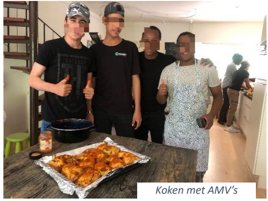
Koken met AMV's